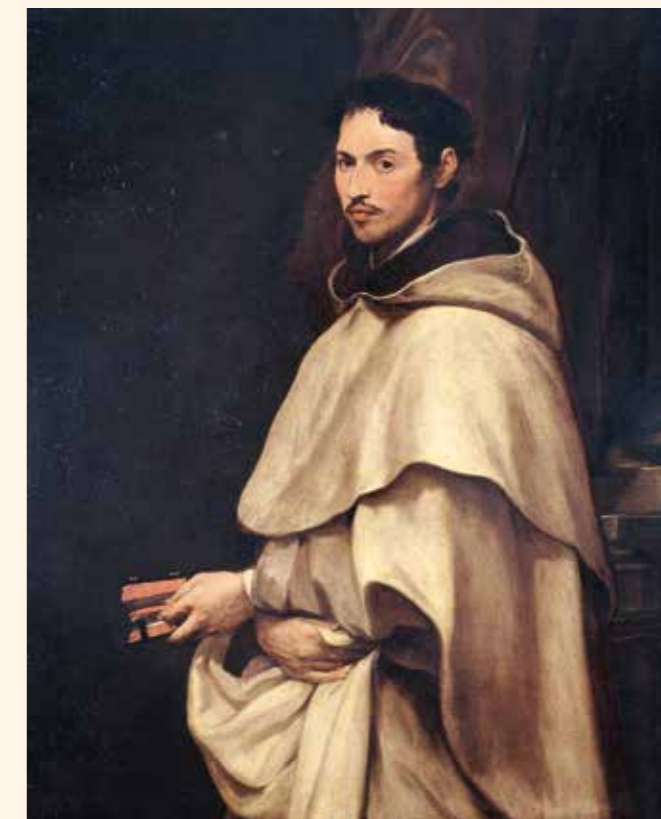
Anthonis van Dyck (1599-1641) (zugeschrieben) Bildnis eines Dominikaners

Städtische Galerie in der Reithalle Paderborn-Schloß Neuhaus