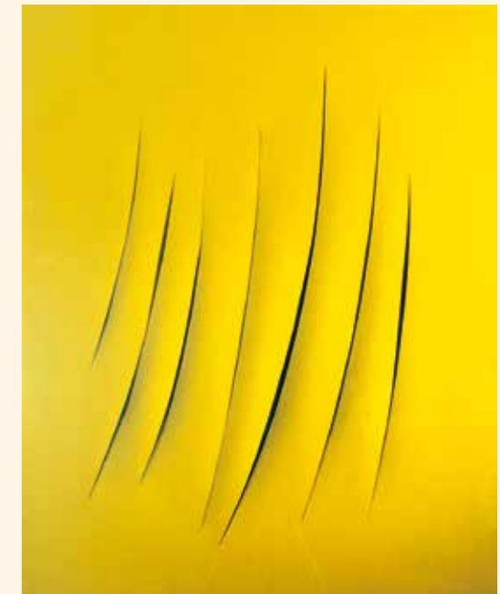
Lucio Fontana Concetto Spaziale (Raumkonzept) , 1962