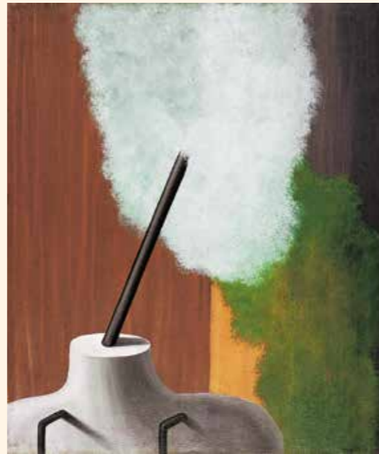
René Magritte (1898 - 1967) Die Rückkehr des Forschers , 1926