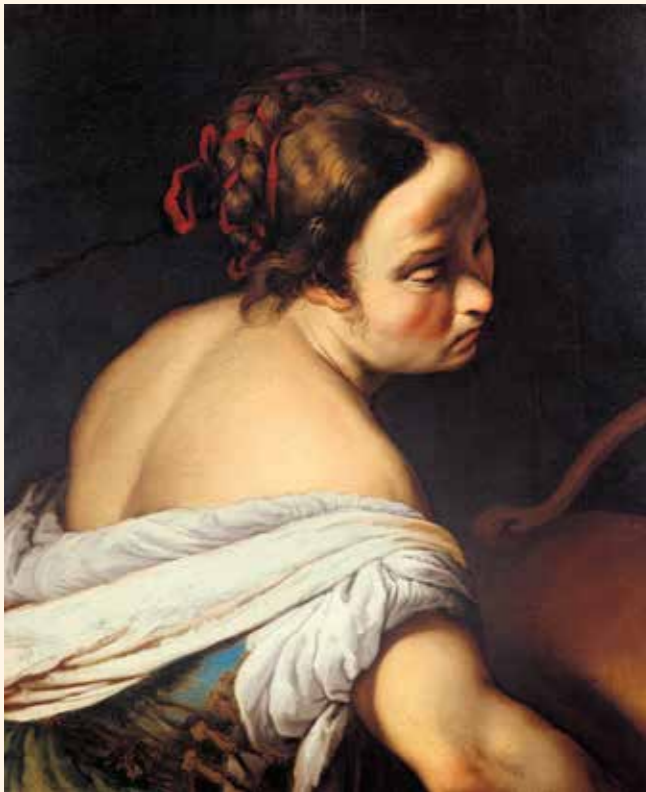
Bernardo Strozzi (1581/82 - 1644) Brustbild einer Frau , um 1629