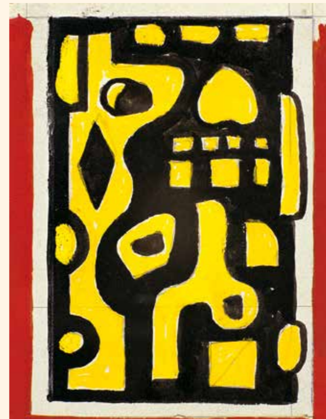
Fernand Léger Komposition in Gelb und Schwarz , 1937

Die Ausstellung in der Reithalle verdankt sich einer Kooperation mit dem Kreis Paderborn, dem Freundeskreis Mantua e.V. und der großzügigen Leihgabe der Ca' la Ghironda. – Die Werkschau mit annähernd 90 Gemälden und Mischtechniken wird im Anschluss an Paderborn im Kunstmuseum Bayreuth gezeigt werden.