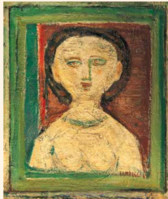
Massimo Campigli (1895 - 1971) Figur , 1967